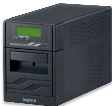
3 100 06